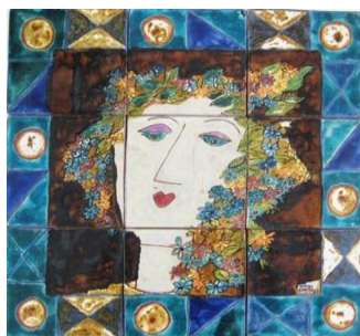
Teresa Cortez, Primavera, 1989 Painel cerâmico relevado, Museu Nacional do Azulejo

Esta estação, que representa o renascer da natureza e o aumento gradual da luz do dia, estende-se até ao solstício de verão em 21 de Junho.